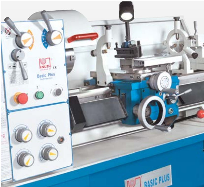
Snelwissel beitelhoudersysteem inclusief