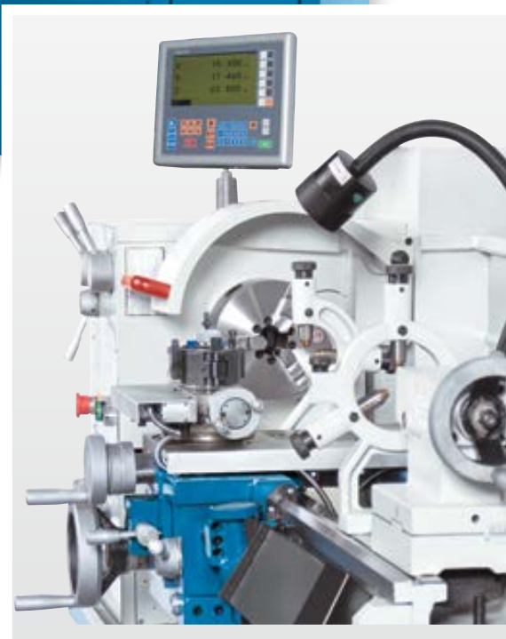
Vaste en meelopende bril inbegrepen in de standaard uitrusting