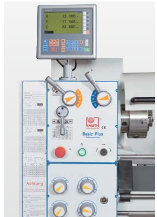
Digitale uitlezing op X, Z en Z 1 -as