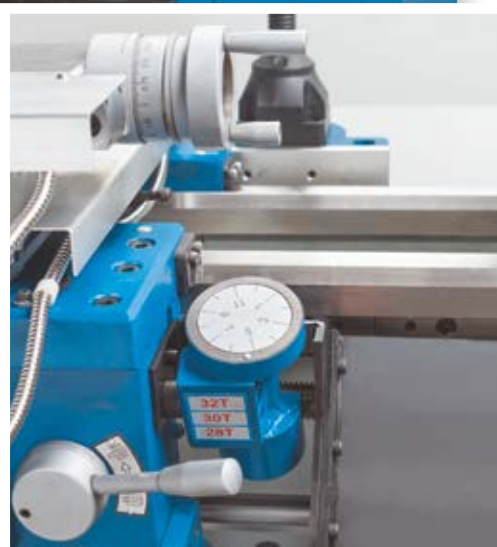
De draadsnijlklok vergemakelijkt het inschakelen van de slotmoer in de juiste gang