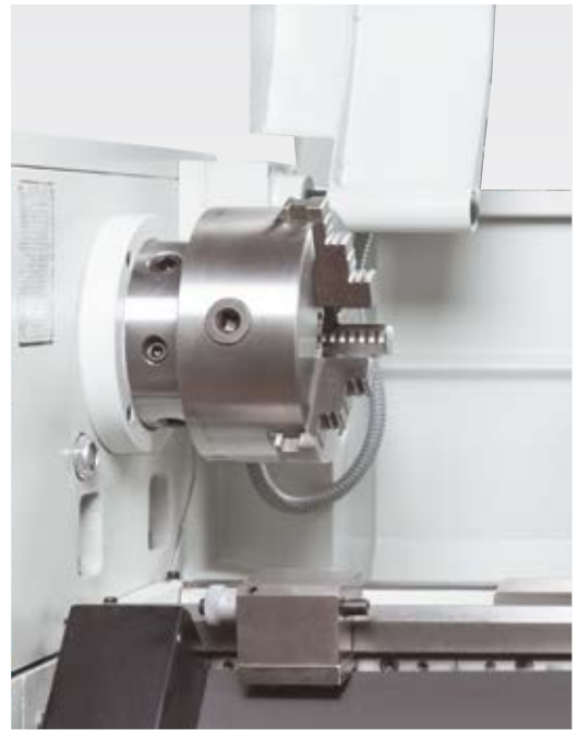
Micrometer langsaanslag voor een hoge repetiteer-nauwkeurigheid